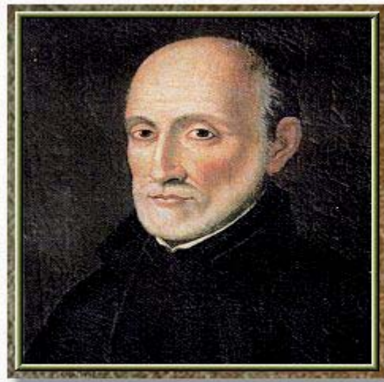
Claudio Aquaviva ( Claudius Acquaviva ) - 1581-1615

Padre Geral da Companhia de Jesus. Depois de Inácio, o mais relevante Geral da 'Sociedade'. É da sua autoria a Ratio Studiorum e teve que ultrapassar graves conflitos com várias personalidades, Estados e instituições, como por exemplo França e Veneza donde os jesuítas foram expulsos, com o Rei de Espanha, com o Papa Sixto V, com os teólogos dominicanos e, dentro da própria Companhia, com a tradicional rivalidade entre os 'dogmáticos' espanhóis e os