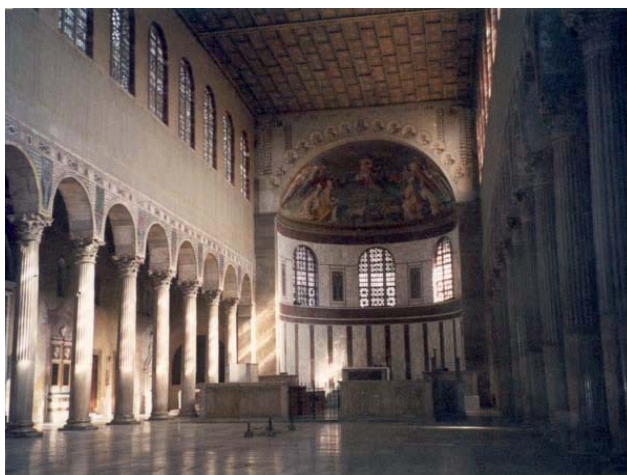
Basílica de Santa Sabina – Roma – sede dos Dominicanos desde o séc. XIII

Papas, à época: Paulo V (1605 – 21); Gregório XV (1621 – 23); Urbano VIII (1623 – 1644); Inocêncio X (1644 – 55); Alexandre VII (1655-67); Clemente IX (1667-69); Clemente X (1670-76).